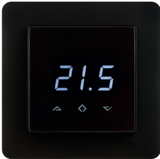
MAGNUM Z-wave negru (optional)